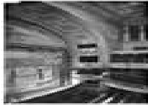
(بمصر المشهد المسرحي ، قبل الحريق (حوالي عام 1925

في عام 1768 ، بدأ تشارلز-أندويه دي لاكور إنشاء مسرح جديد بهذا الاسم في العاصمة الجديدة لفرانكس-كومتيه . بنيت الأوبرا بين عامي 1778 و 1784 من قبل المهندس المعماري كلود جوزيف الكستور بيرتراند ، وفقا لخطط كلود نيكولاس .